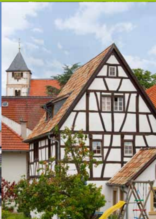
Ältestes Haus der Gemeinde